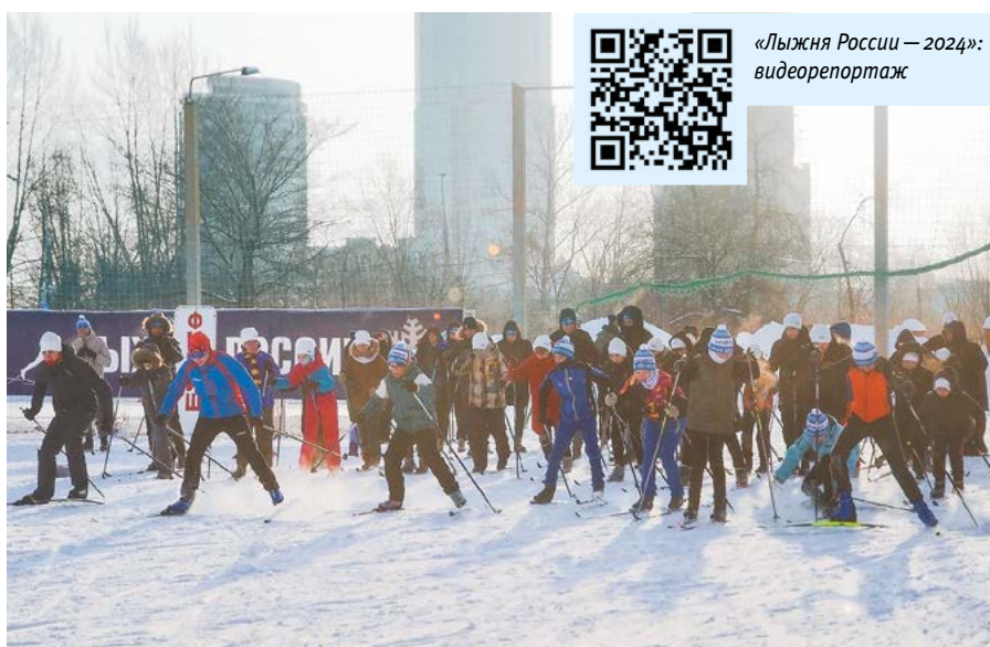
«Лыжня России – 2024»: видеорепортаж

в свои руки и очень оперативно провели все забеги, подбадривая участников. Для всех желающих была организована работа теплого помещения спорткомплекса, где можно было согреться горячим чаем со вкусной выпечкой.