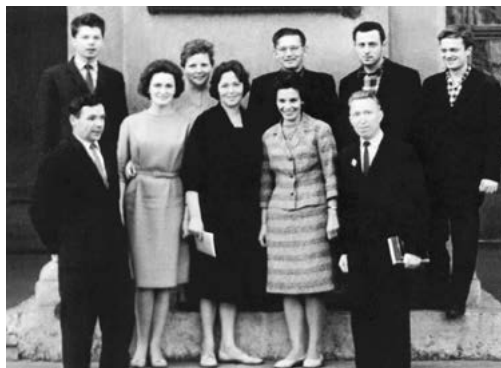
Кафедра «Автоматика и телемеханика на ж.д. транспорте», 1963 год

Связан научными интересами и многими годами совместной деятельности со службой автоматики и телемеханики электротехнический факультет. В лабораториях факультета ведутся научные исследования по разработке и внедрению измерительных приборов для диагностирования устройств автоматики и телемеханики, совершенствованию ме-