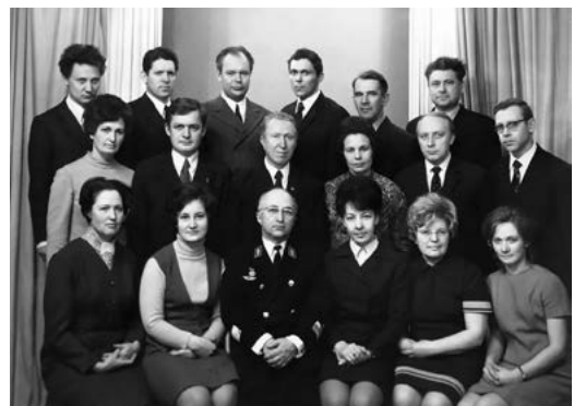
Кафедра «Автоматика и телемеханика на ж.д. транспорте», 1973 год